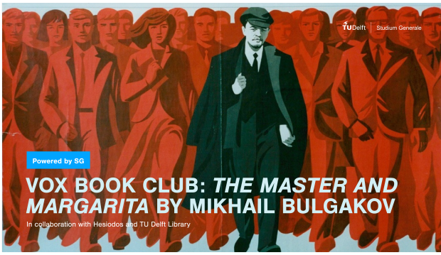
Aankondiging VOX Book Club