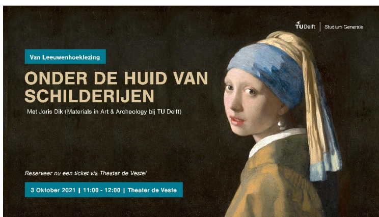
Aankondiging Van Leeuwenhoeklezing