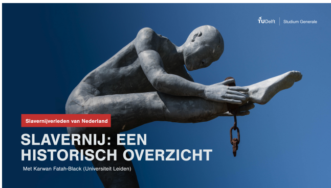
Aankondiging Collegereeks Slavernijverleden