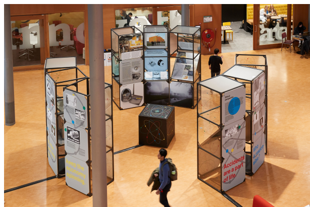
Sfeerbeeld Atomic Reactions