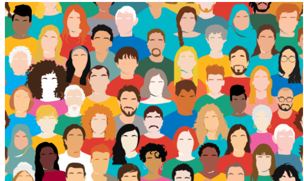
Aankondiging D&I Week