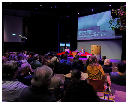
Sfeerbeeld Filosofisch Café