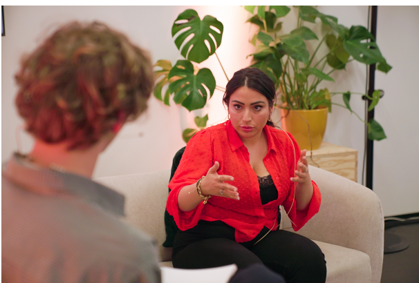
Sfeerbeeld SG in Conversation