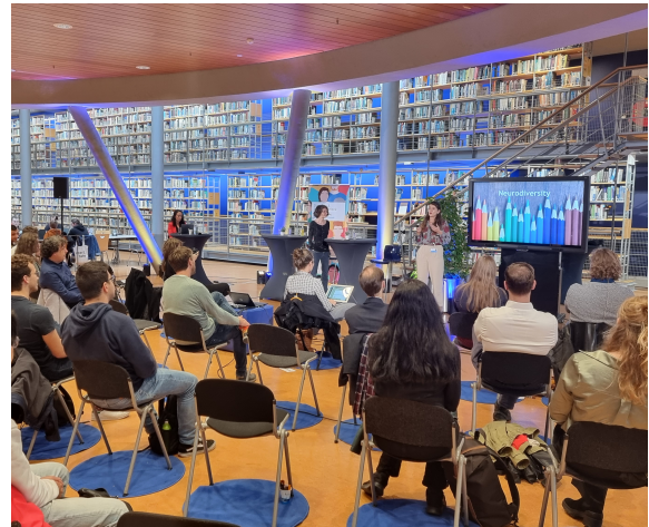
Sfeerbeeld Prometheus' Problems