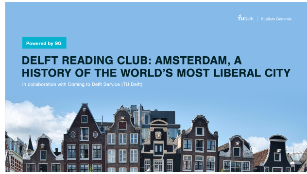
Aankondiging Delft Reading Club