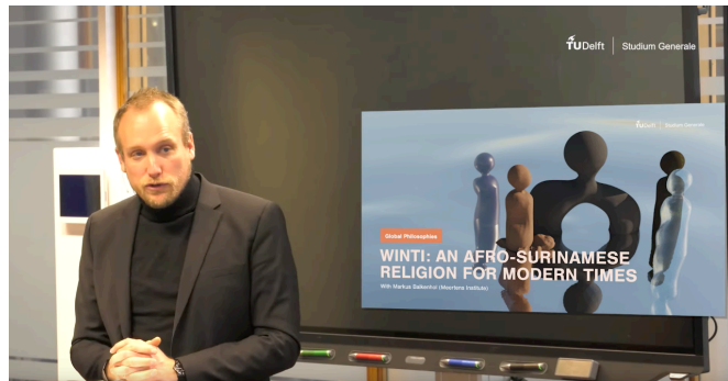
Sfeerbeeld Global Philosophies