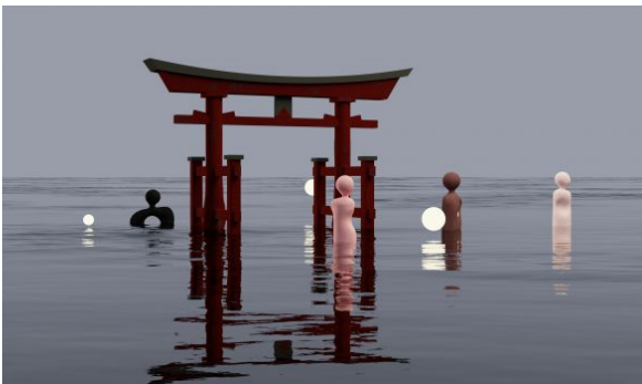
Aankondiging Global Philosophies